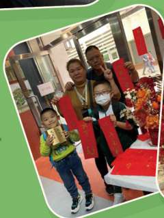
「春分之日影」 幸福曬藍