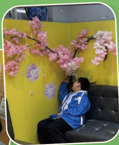
幸福駅 · 感恩祭