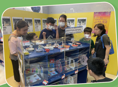
春季展覽 幸福之作